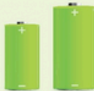
C- en D-batterijen