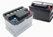
Tractie- en autobatterijen